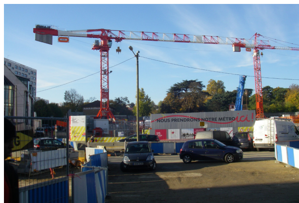
Retrouver les espaces verts affectés par le chantier du métro.

gestion nouvelle des parkings insuffisamment utilisés, inadaptés ou peu sécurisés, afin notamment de favoriser le commerce diversifié.