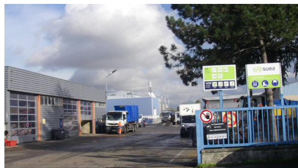
Ne pas se laisser enfermer dans des activités consommatrices d'espaces et peu créatrices d'emploi.