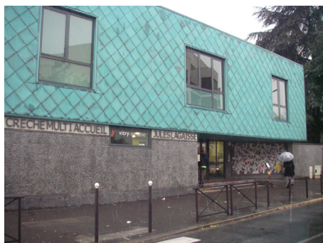
La crèche multi-accueil Jules Lagaisse.

L'action sociale globale doit être encouragée. La priorité est de veiller à ce qu'il n'y ait pas des oublié.e.s des droits sociaux et des prestations sociales.