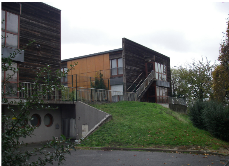
L'Ehpad intercommunal « Les Lilas » dans le quartier du Fort d'Ivry.