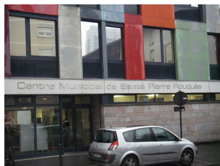
Le Centre municipal de santé.

● Œuvrer en permanence pour la gratuité scolaire, ainsi que dans les sorties scolaires, imposer une extension de la tarification sociale pour la restauration en partenariat avec l'État, le Département et la Région, dont les responsabilités respectives sont déterminantes.